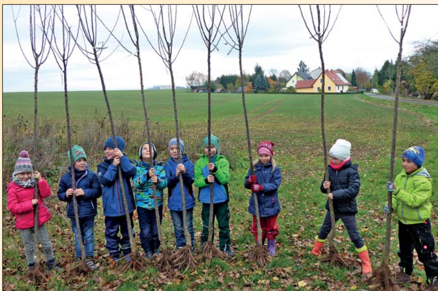
Langhennersdorfer Schulanfänger pflanzten am 5. November an der Pflaumenallee hinter der Langhennersdorfer Kirche ihren eigenen Jahrgangsbaum

Eine Baumpflanzaktion der besonderen Art organisierten die Langhennersdorfer Mitglieder des Ortschaftsrates.