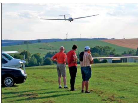
Fluglehrer beim Bewerten des ersten Alleinfluges