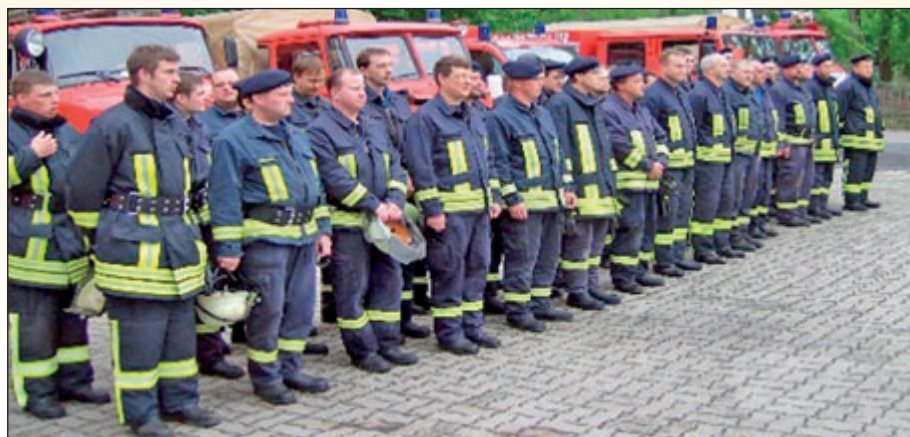
Auswertung einer Großübung der Gemeindefeuerwehr

Mit kameradschaftlichen Grüßen Karl-Heinz Zönnchen, Gemeindefeuerwehrleiter