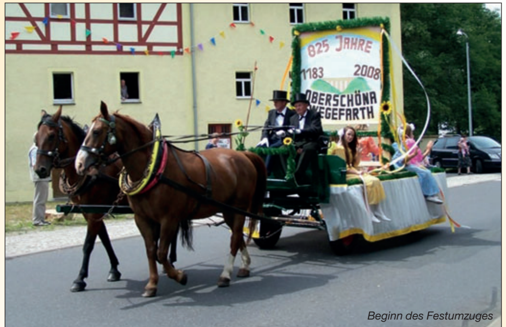
Beginn des Festumzuges