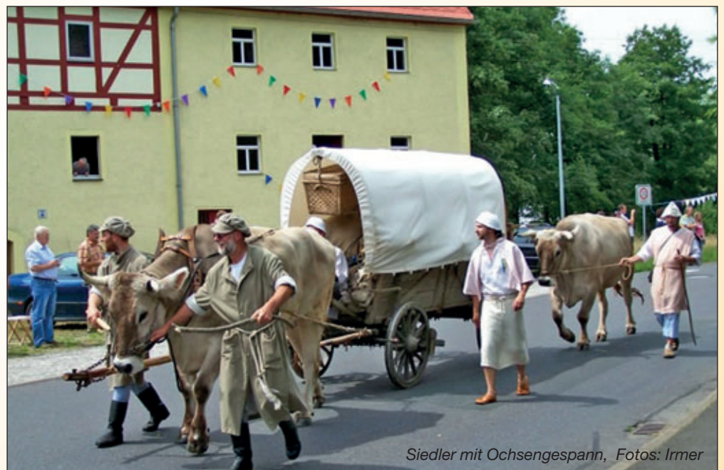
Siedler mit Ochsespann